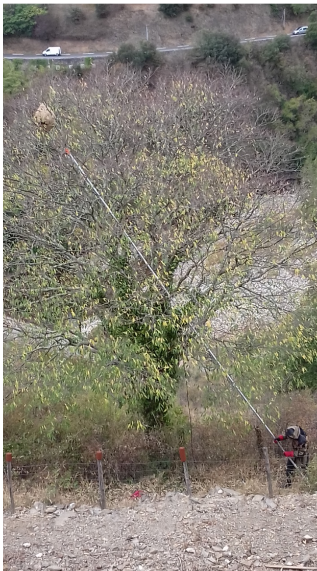
Destruction d'un nid par un désinsectiseur agréé

La destruction de ces nids limite la prolifération de ces insectes qui font des ravages sur les ruchers. Car les frelons asiatiques perturbent l'activité des abeilles et ils en prélèvent.